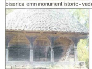
biserica de lemn monument istoric - vedere vestica

Biserica de lemn din frînă, monument istoric construit în anul 1823 este o bijuterie în ansamblul privitorilor, care după desigurarea așii cu țiglar de arce, se fermează din grimele dină