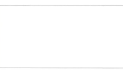
CLADIRE nr. 240

Casa de la nr. 240 are anexă gospodărești vechi și frumoase