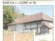
ANEXA CLADIRE nr 36

Casa cu numărul 36 datează din perioada interbelică fiind un exemplu reușit, armonios de edificiu local.